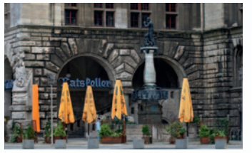
Appaloosa | commons.wikimedia.org | Ratskeller Leipzig 2010 creativecommons.org | licenses by-sa 3.0 legalcode

Gesellschaftsabend Datum Freitag, 21. April Uhrzeit 19:30 Uhr Ort Ratskeller Gebühr 65 EUR